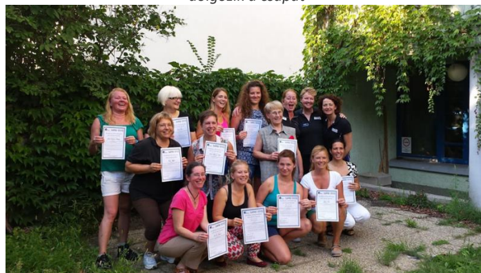
... az első 12 gyógytornász, akik OTAGO Tréneri oklevelet kaptak ... a hátsó sorban jobb oldalon az angol Later Life Training 3 munkatársa ...