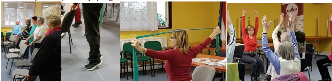
„Ne ess, Ne törj” torna – Osteoporosis Betegek Klubja