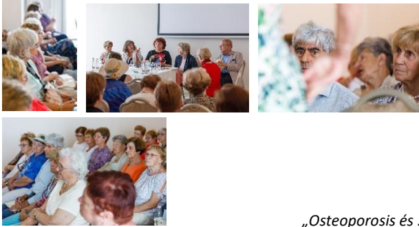
„ Osteoporosis és ... 2019 ” a beszélgetés résztvevői és a hallgatóság

A legutóbbi fórum az „ Osteoporosis és ... 2019 ” címet kapta.