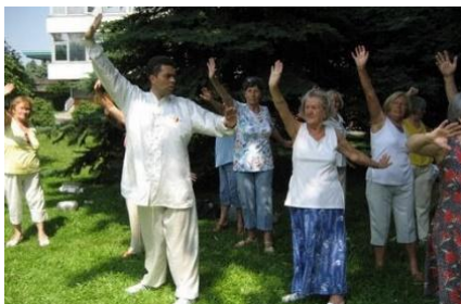
... 2007 Balatonfüred, Hotel Füred kertjében