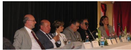
Európa Hajó - 2004

2016-ban rendhagyó módon a Rózsák Terén, Budapesten több idős klub részvételével tartottunk egy táncos, ernyős bemutatót, felhívva a figyelmet a férfi-oszteoporózisra.