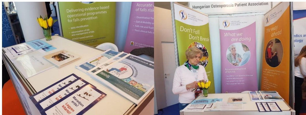
Krakkóban 2018-ban az ECCEO Kongresszuson kiállítási standdal vettünk részt

A Nemzetközi Osteoporosis Alapítvánnyal különösen jó a kapcsolat. A pandémia előtt, kongresszusainkon több munkatársunknak ingyenes regisztrációt biztosítottak. 2018-ban Krakkóban az European Congress on Osteoporosis and Osteoarthritis (ECCEO) rendezvényen lehetőségünk volt arra, hogy tevékenységünket az „Osteoporosis Faluban” bemutathassuk.