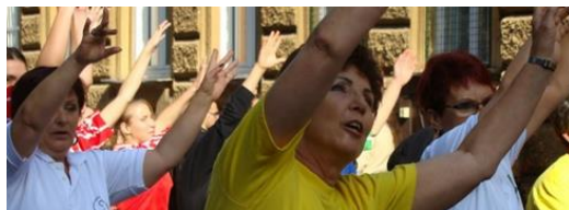
2016-ban a Budapesten a Rózsák terén; férfi-oszteoporózis

Több kampányt is elindítottunk (Törekedjél, hogy ne törjél – Törje magát csontjai érdekében ...), ezek közül kiemelném közös programunkat a TETRÁPAK-kal; itt a tejfogyasztás fontosságára hívtuk fel a figyelmet. Budapesten, Miskolcon, Szegeden, Debrecenben, az ottani plázákban felállított standunkon felnőtteket, gyermekeket láttunk vendégül egy-egy pohár tejre. A csontritkulás rizikófaktorairól, tüneteiről, megelőzéséről, arról, hogy hogyan éljünk a betegséggel együtt, folyamatosan ismertetések hangzottak el.