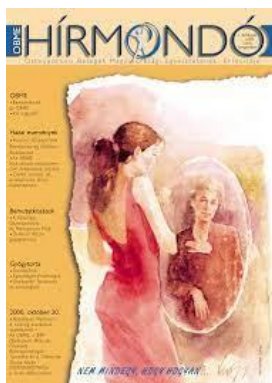
... a Hírmondó 1.száma

Állandó rendezvényeinken , a minden évben megrendezett igen népszerű programokon általában 150-200 fő vett részt, ezek többnyire a csontritkulás klubok tagjai voltak; ilyen volt az Osteoporosis Civil Fórum is Balatonfüreden. Az orvostársaság kongresszusához, az Osteologiai Kongresszushoz csatlakoztunk, különböző témákról szerveztünk beszélgetéseket, pl.: „Erős nők és törékeny férfiak”, „Nem az számít, hogy mennyi idős vagy, hanem az, hogy hogyan lettél annyi”, „Idősen is egészségesen”, „Becsüljük meg csontjainkat”, „Öreg csontok nem vén csontok”, „Infokommunikáció” (erről videoklip is készül; több más videónkkal együtt megtalálható a You Tube- on: