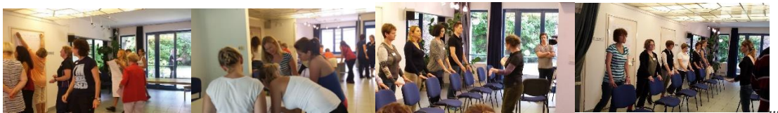
dolgozik a csapat

Pályázati sikereinkhez tartozik még, hogy bekerültünk az Európai Bizottság által támogatott 2014 ben kezdődő ProFouND hároméves - 21 konzorciumi partnerrel futó - programba. A program célja az infokommunikációs eszközök alkalmazásának elterjesztése, egy esősorban Európára kiterjedő online hálózat kialakítása az idősek elesésének megelőzése érdekében. Ekkor alakítottuk ki, építettük fel online hálózatunkat a közösségi médiában a FB on. Több mint 10 oldalunk, csoportunk ma is működik: „Osteoporosis és séta”, „Osteoporosis és tánc”, „Osteoporosis és táplálkozás”, „Korban Karban (Age and Care)”, „Lifestyle ACademy of Elderly (LACE)”, „Krónikus betegségek- időskor”, „eHealth-Telemedicina-Telehealth-Patients”, „Törődjünk Egészségünkkel - Betegek Egyeteme”, „OBME Klubok” ... A ProFouND program keretei között lehetőséget kaptunk arra is, hogy 2015 -ben a Magyar Gyógytornász-Fizioterapeuták Társasága Geriátriai Munkacsoportjával együttműködve, az angliai Later Life Training munkatársaival együtt gyógytornászok részére szervezzünk tanfolyamokat az OTAGO módszer betanítására, elsajátíttatására.